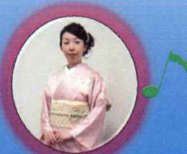
歌手:綿貫ゆか(平田出身)