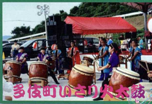
多伎町のさり火太鼓