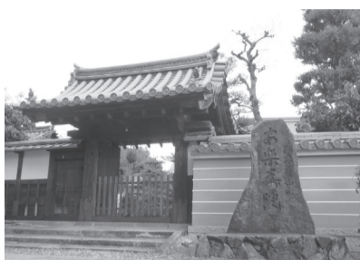
幕末には鳥羽・伏見の戦いの本営となった