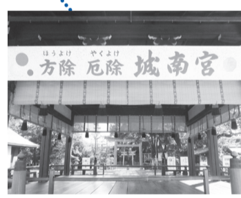
方除(ほうよけ)大社と仰がれています