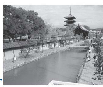
歩道橋から見る東寺 東寺真言宗の総本山796年建立 1994年世界遺産に登録されました