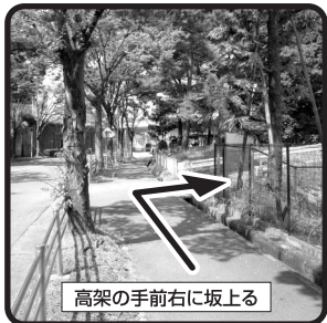
高架の手前右に坂上る