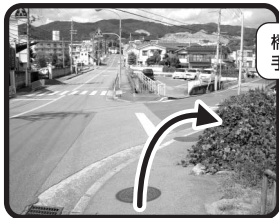
橋を渡らず 手前を右折