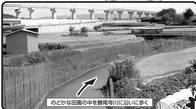
のどかな田園の中を勝尾寺川に沿いに歩く

ゴールでミスウォーキングシューズなどステキなグッズが当たる抽選会を実施いたします。またチエーストレッチ講座も開催いたします。