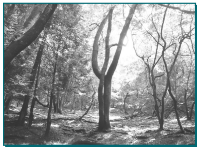
秋の色づきを感じる森