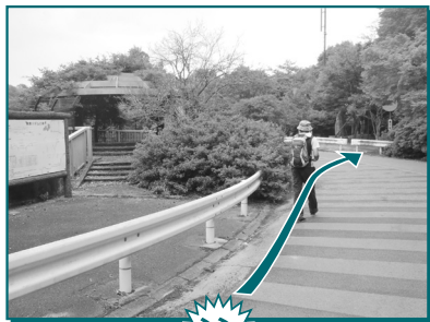
滝道を歩いてゴールへ