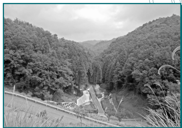
車道との合流地点からの眺望