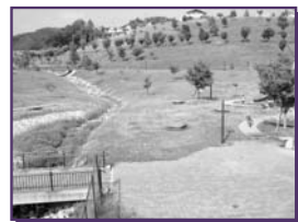
箕面森町近隣公園 休憩ポイント