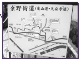
余野街道の案内板