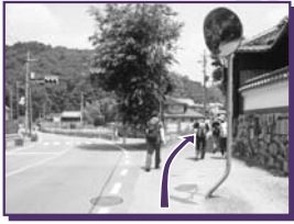
4 不死王閣前の信号を右方向に進む