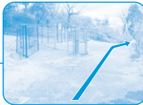
フェンスの少し先を右に入る