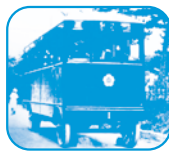
開業当時のトロリーバス