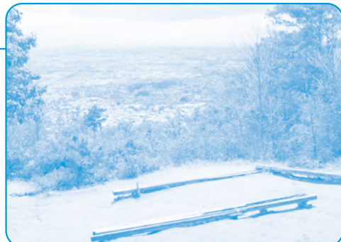
4 石切山 晴れた日には「あべのハルカス」が見えます