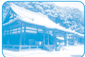
5 満願寺 (境内での飲食禁止)