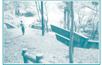
桜広場から 龍安寺方面へ下る