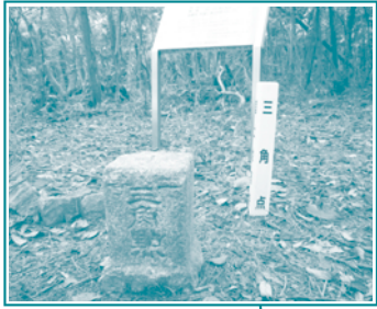
E 六個山 ▲395.9m

◎集合場所：阪急・箕面駅前（阪急宝塚線・石橋駅で箕面線にのりかえ） ◎集合時間：午前10時～10時30分