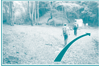
F ハート広場 斜め右へ進む