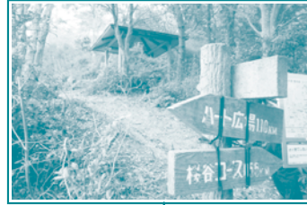
H 望海の丘 (屋根付休憩所) ビューポイント