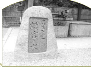
水無瀬川の伏流水、名水百選にも選ばれた「離宮の水」