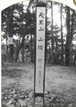
D 天王山山頂・山崎城跡 城跡は羽柴秀吉の築城によるものです

E 十方山 ▲304.4m 右手に茶色い木の道標 ロープに沿って進む このあたりからゆるやかな下り