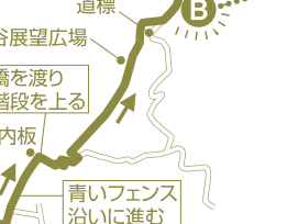
D 天王山山頂・山崎城跡 城跡は羽柴秀吉の築城によるものです