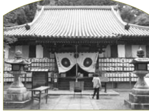
A 宝積寺「打出」と「小槌」を祀っていることから通称「宝寺」として商売繁盛のお寺として知られている