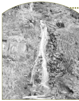
F 水無瀬の滝 滝谷川が天王山断層によって生じた高さ20メートルの滝で水枯れをしたことがないといわれています