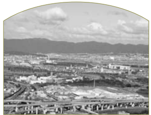
B 旗立松・展望台 (山崎合戦の地碑)