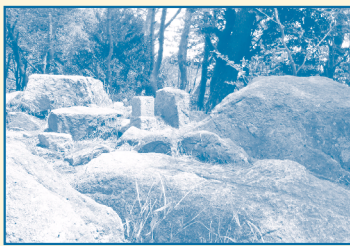
② 油コブシ ゴロゴロした石の 間に三角点がある