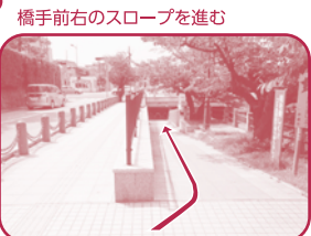
橋手前右のスロープを進む