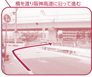
橋を渡り阪神高速に沿って進む