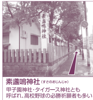
素盞鳴神社 (すさのおじんじや) 甲子園神社・タイガース神社とも呼ばれ、高校野球の必勝祈願者も多い