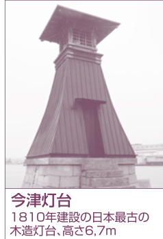
今津灯台 1810年建設の日本最古の木造灯台、高さ6.7m

★持ち物 弁当・飲み物・雨具・救急薬品等をご持参のうえ、集合場所へお越しください。 ◎元気な人であれば、どなたでも参加いただけます。ただし、健康状態のすぐれない方は参加をご遠慮ください。ご自分の体力、体調をチェックされたうえで参加ください。参加者のけがや他に与えた損害などについては主催者は一切の責任を負いません。万一事故が生じた場合の費用は参加者負担となります。◎係員の指示、及び注意事項は必ず守ってください。◎別行動をとられた場合は、阪急のせでんハイキング参加に関係のない方とさせていただきます。◎天候の急変等、主催者の判断によりコースを変更することがあります。あらかじめご了承ください。