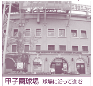
甲子園球場 球場に沿って進む