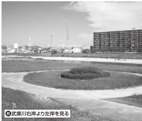
B 武庫川右岸より左岸を見る