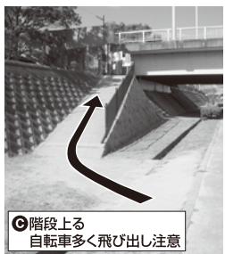
階段上る 自転車多く飛び出し注意