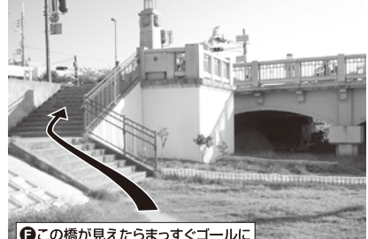
F この橋が見えたらまっすぐゴールに