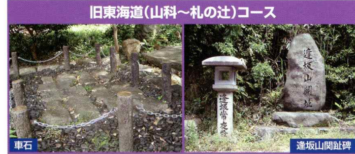
旧東海道(山科~札の辻)コース