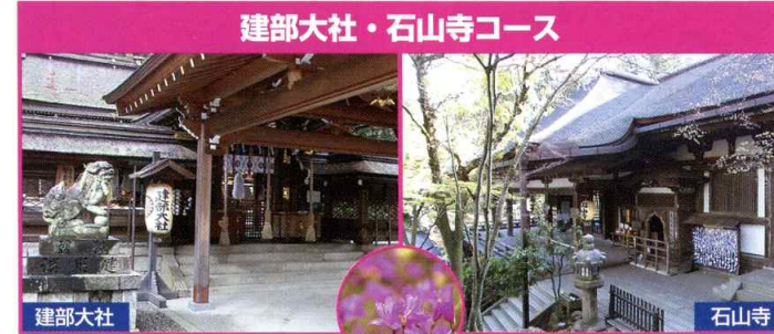
建部大社・石山寺コース