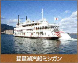
琵琶湖汽船ミシガン