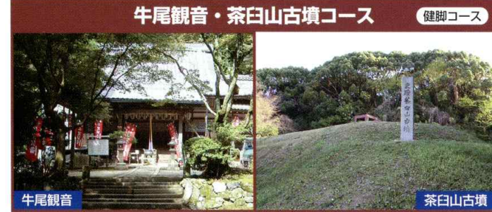
牛尾観音・茶臼山古墳コース