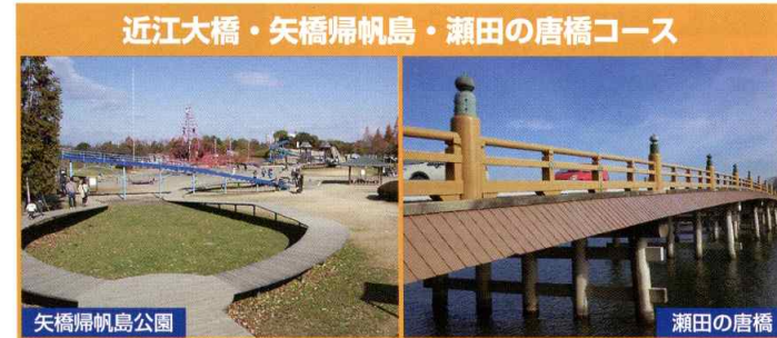
近江大橋・矢橋帰帆島・瀬田の唐橋コース