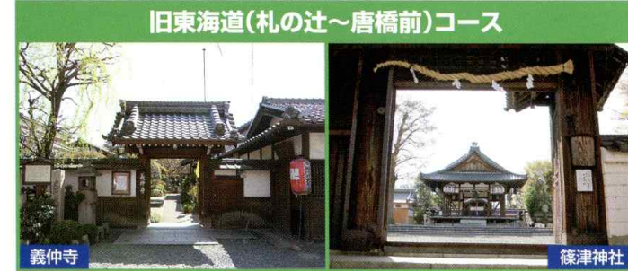
旧東海道(札の辻~唐橋前)コース