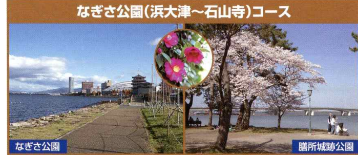
なぎさ公園(浜大津~石山寺)コース