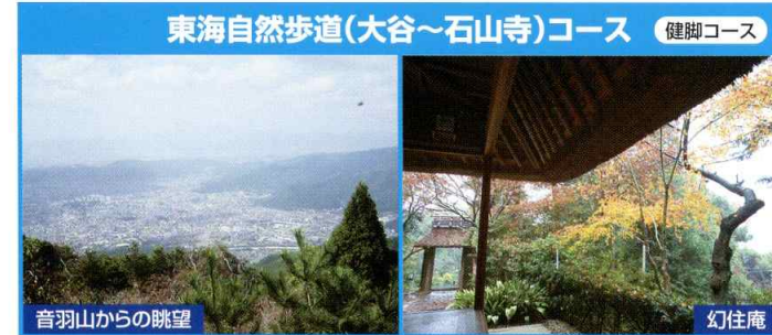
東海自然歩道(大谷~石山寺)コース