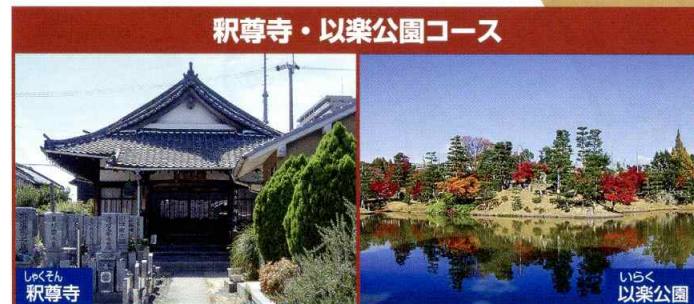
稲尊寺・以楽公園コース