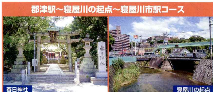
郡津駅～寝屋川の起点～寝屋川市駅コース