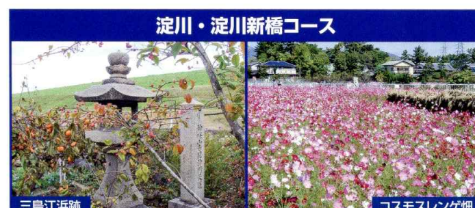
淀川・淀川新橋コース