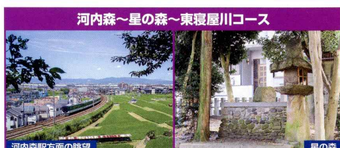
河内森～星の森～東寝屋川コース

●お問い合わせ 京阪電気鉄道株式会社 鉄道営業部事業課 〒540-6591 大阪市中央区大手前1丁目7番31号(O MMビル) ☎06-6944-2593