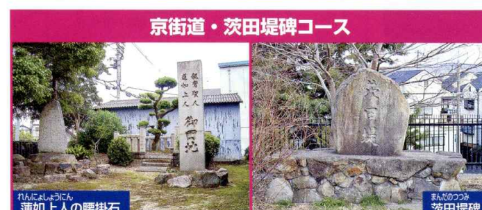
京街道・茨田堤碑コース