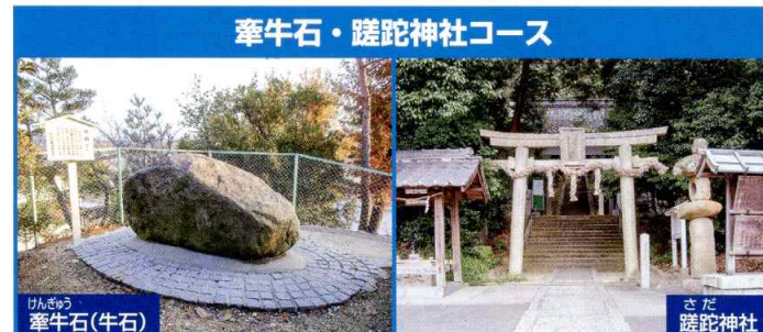
牽牛石・毘陀神社コース