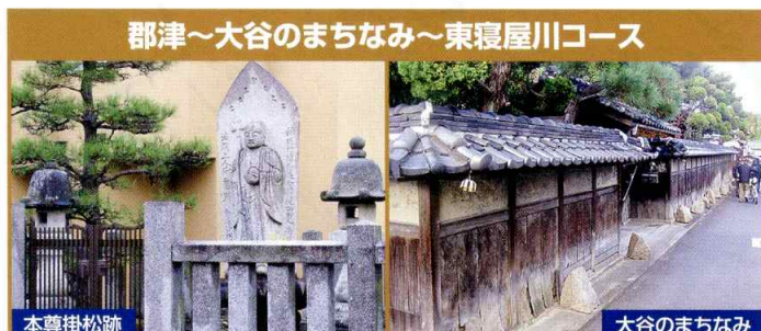
郡津～大谷のまちなみ～東寝屋川コース