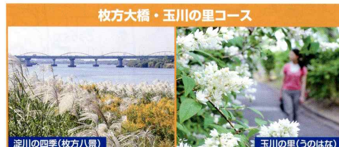
枚方大橋・玉川の里コース