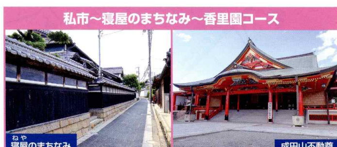
私市～寝屋のまちなみ～香里園コース