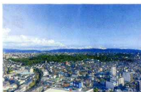
大迫力の眺望が楽しめる

街並みが広がり、遠くは六甲山、あべのハルカス、生駒・金剛山などが見渡せます。くつろげる喫茶コーナーもあります。9:00～21:00、年中無休。