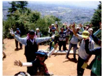
D 石切山からの絶景