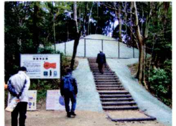
F 勝福寺古墳は6世紀初め頃の前方後円墳