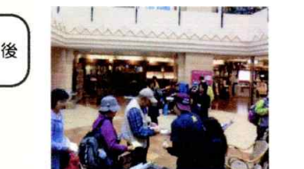
G 涼しいモザイクボックス館内がゴール