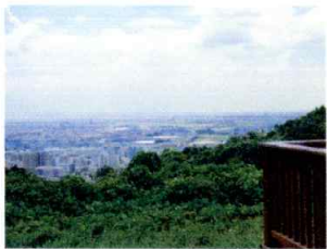
E みはらし広場からの眺望