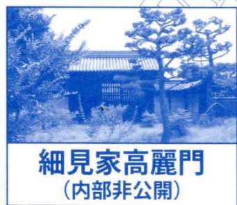
細見家高麗門 (内部非公開)