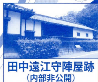
田中遠江守陣屋跡 (内部非公開)