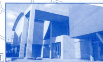
府立弥生文化博物館

【ご注意】 ※「フリーぶらり」ではスタッフの同行、矢印等はありません。 ※スタート受付で配布する地図を参考に、自由に歩いていただくハイキングです。 ※ゴールでの受付等もありません(自由解散)。