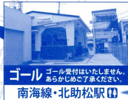
ゴール ゴール受付はいたしません。 あらかじめご了承ください。 南海線・北助松駅