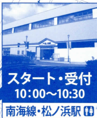
スタート・受付 10:00～10:30 南海線・松ノ浜駅