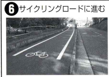
6 サイクリングロードに進む