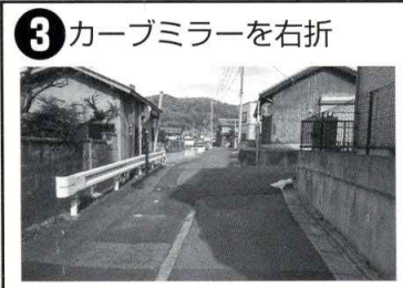
3 カーブミラーを右折