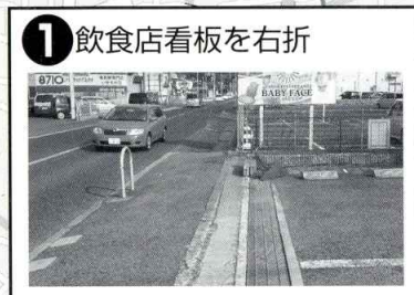
1 飲食店看板を右折