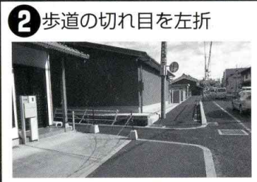
2 歩道の切れ目を左折