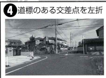
4 道標のある交差点を左折