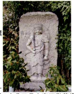
翼のある日月大高不動尊像 建立年不詳