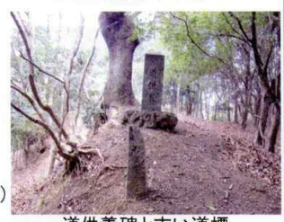
道供養碑と古い道標