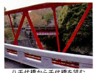
八千代橋から千代橋を望む