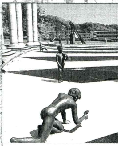
偉人、科学者のオブジェ 野口英雄・アインシュタイン・ミケランジェロなど (サイエンスプラザ)

アルキメデスのネジ (サイエンスプラザ) 中空の管を回転させ水を汲み上げる装置。ハンドルを回転させると、池の水が管を通過して上がってきます。