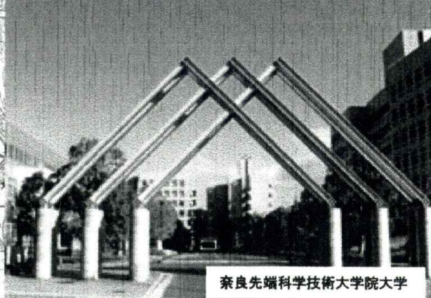
奈良先端科学技術大学院大学

高山サイエンスプラザ (研究交流施設) (公財)奈良先端科学技術大学院大学支援財団が行う国立大学法人奈良先端科学技術大学院大学への支援、産学交流及び地域交流などの活動拠点。 高山サイエンスプラザは4階建て、総床面積は5451㎡の建物です。1993年10月に竣工。