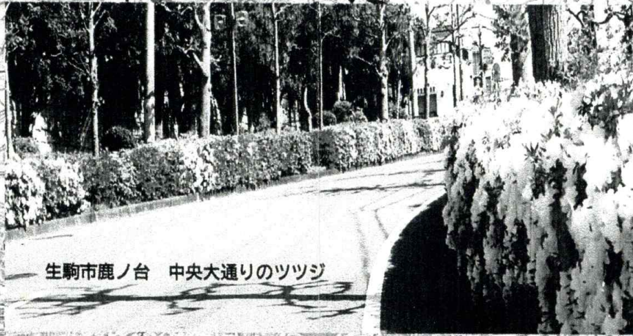
生駒市鹿ノ台 中央大通りのツツジ

奈良先端科学技術大学院大学 奈良県生駒市に本部を置く国立大学です。通称は「NAIST(ナイスト)」。1991年に本学は設置されました。研究施設が集まる「けいはんな学研都市」の奈良県生駒市に、キャンパスは位置しています。キャッチコピーは「無限の可能性、ここが最先端-Outgrow your limits-」です。