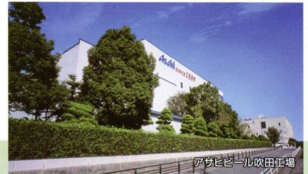
アサヒビール吹田工場