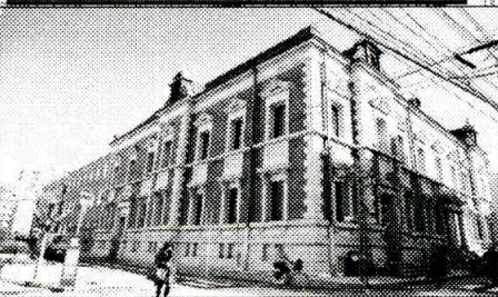
旧京都郵便電信局(中京郵便局)

・1902年竣工。吉井茂則・三橋四郎の設計。 ・端正なルネッサンス風のデザインが美しく京都市登録有形文化財。