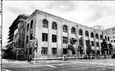
旧京都中央電話局(新風館)

・1926年竣工。設計は吉田鉄郎。 ・旧京都中央電話局の建物を2020年リニューアル。