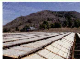
町内唯一の寒天干し風景