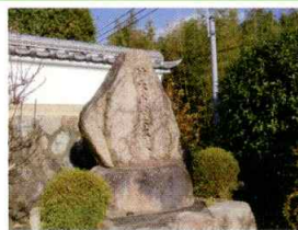
浄瑠璃の石碑【竹本中美太夫】