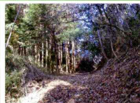
丹州街道の難所 大部峠