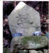
大部峠の馬頭観音