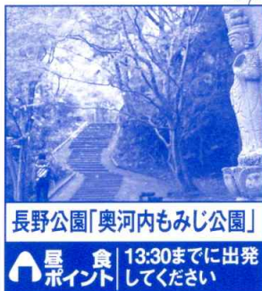
長野公園「奥河内もみじ公園」 昼食ポイント 13:30までに出発してください