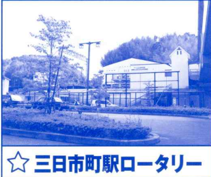
☆ 三日月町駅ロータリー