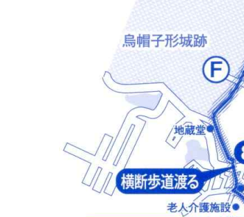
⑤ 高野街道(三日市宿場跡)