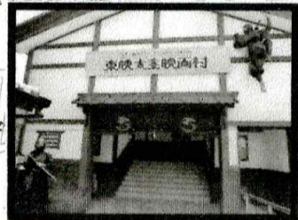
東映太秦映画村(撮影所口)