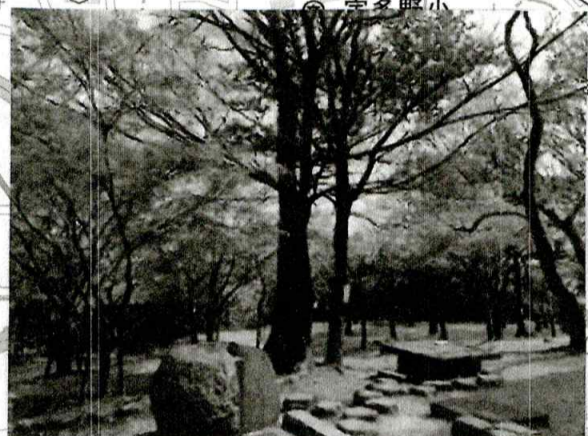
こもれびの広場 昼食 WC