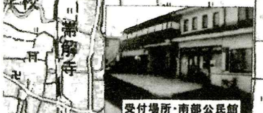
受付場所・南部公民館

奈良市香積山にある正暦寺。正暦3年(992年)一休天皇の勅諭により創建。堂塔伽藍86坊が宿願を誇っていましたが、平重衡の焼き討ちにあい、一時は廃墟となっていました。その後、建保6年(1219)信円僧正が法相宗の宇間所として再興。後、浄土宗の念仏道場として法灯を受け継いできました。本尊薬師如来(白鳳時代)は台座に足を開いて腰を掛けておられるユニークな仏像です。境内に香積山の清流があり、その清冽な水を使って、それまでの濁り池からここで清流が初めて造られたと伝えられています。紅葉の美しさから、古人は「錦の里」と名付けていました。