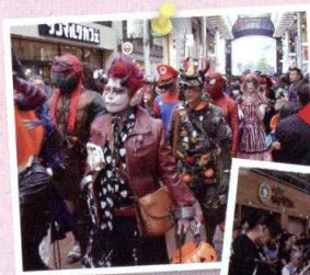
もとまちハロウィン