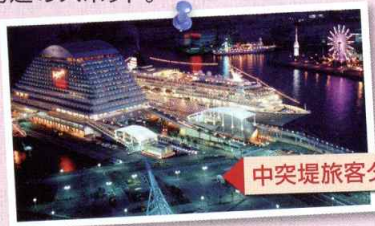
中突堤旅客ターミナル

開港150年を記念してメリケンパークも親水性豊かなスポットに衣替え。ハーバーランド～元町商店街～メリケンパークの「みなと元町」界隈の散策をお楽しみください。