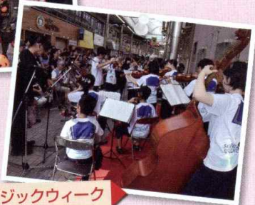
神戸元町ミュージックウィーク