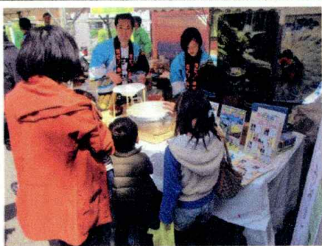
【お米のすくいどり】 ①10時～②12時～