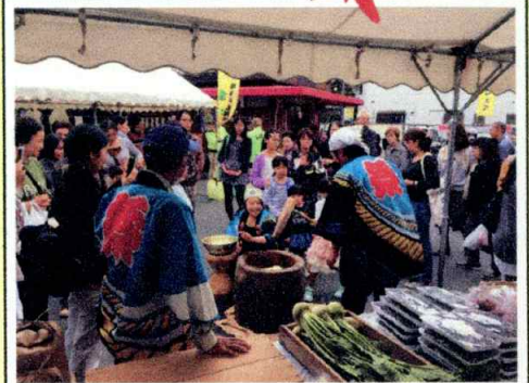
【餅つき振る舞い】 ①11時～②13時～