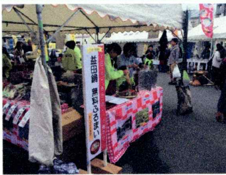
【益田鍋振る舞い】 11時～