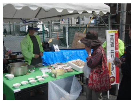
【益田鍋振る舞い】 11時～