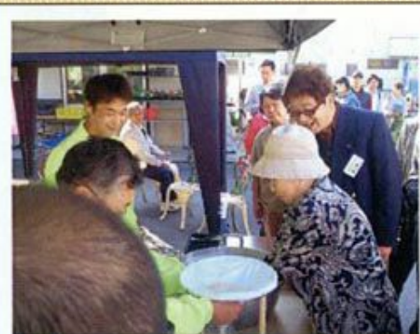
【お米のすくいどり】 ①10時～②12時～