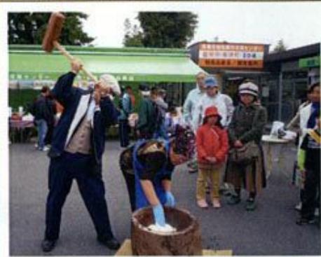
【餅つき振る舞い】 ①11時～②13時～