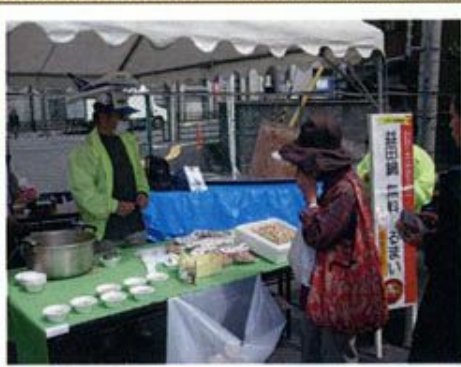
【益田鍋振る舞い】 11時～