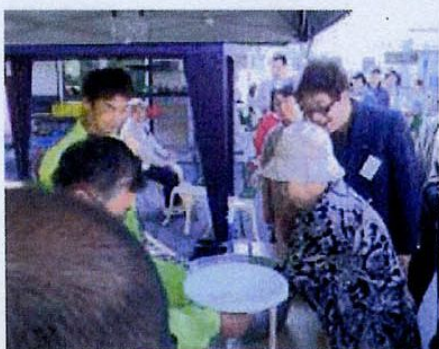
【お米のすくいどり】 ①10時～②12時～