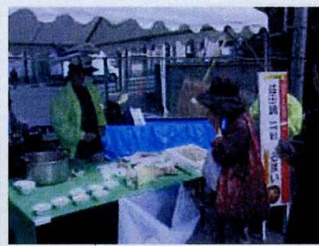
【益田鍋振る舞い】 12時～