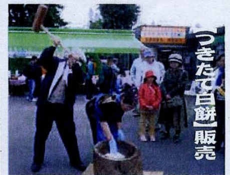
【餅つき振る舞い】 ①11時～②13時～