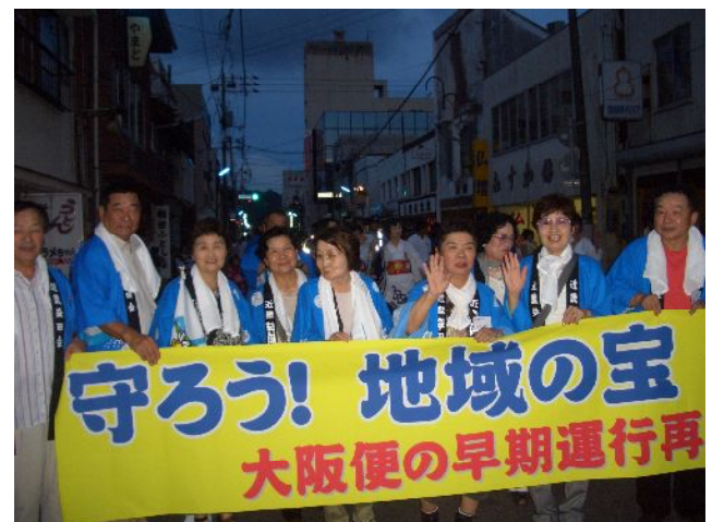
守ろう! 地域の宝 大阪便の早期運行再