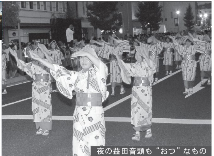
夜の益田音頭も“おつ”なもの