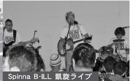
Spinna B-ILL 凱旋ライブ