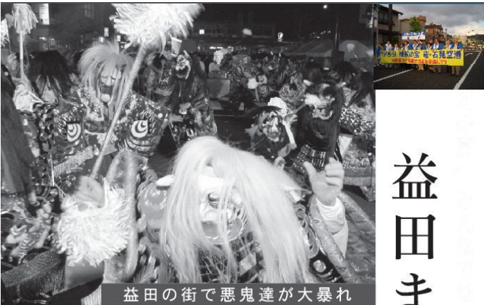
益田の街で悪鬼達が大暴れ