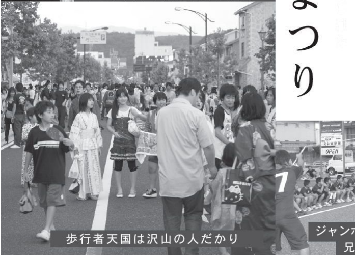
歩行者天国は沢山の人だかり

7月24日、今まで春の恒例行事だった「益田まつり」が、初の試みで夜の夏まつりになりました。色々なイベントが開催される中、12,000人の方々が足を運び、駅前通りを中心とした会場は粋(イキ)な浴衣姿で賑わいました。