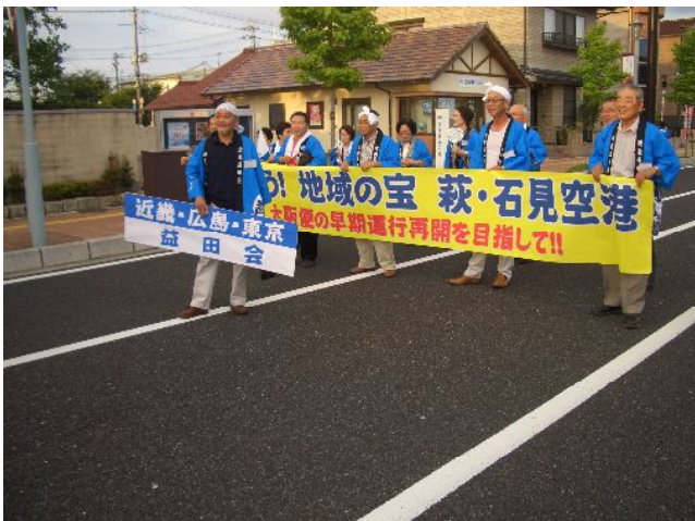
近畿・広島・東京 益田会 守ろう! 地域の宝 萩・石見空港 大阪便の早期運行再開を目指して!!