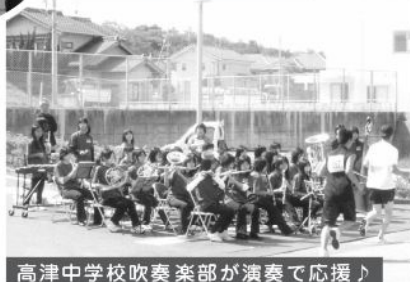
高津中学校吹奏楽部が演奏で応援♪