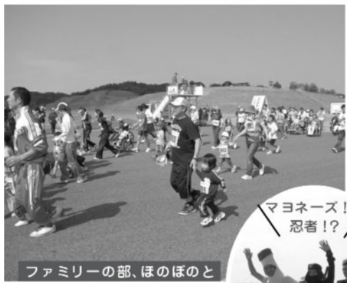
ファミリーの部、ほのぼのと