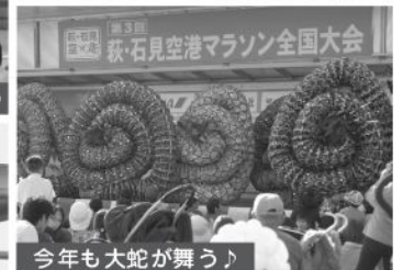
今年も大蛇が舞う