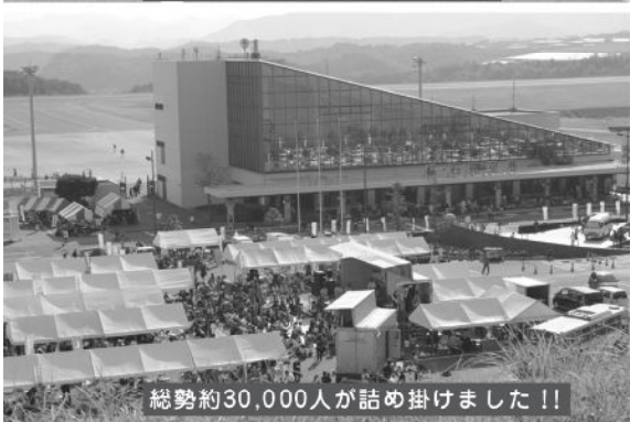
総勢約30,000人が詰め掛けました!!