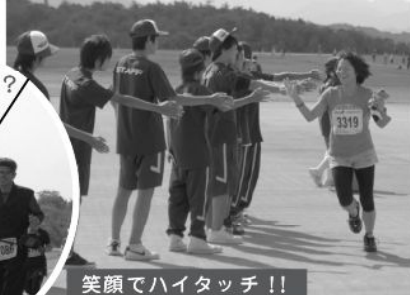
笑顔でハイタッチ！！