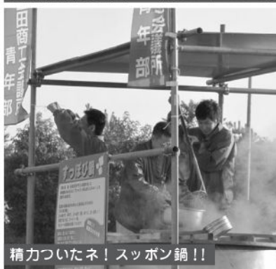
精力ついたネ! スッポン鍋!!