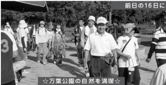
☆万葉公園の自然を満喫☆