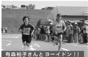
有森裕子さんとヨーイドン！！