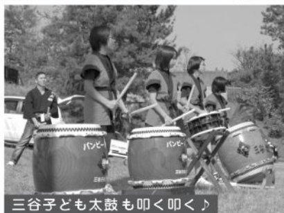
三谷子ども太鼓も叩く叩く♪