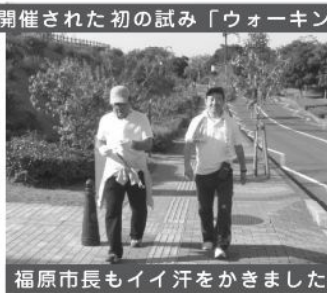
福原市長もイイ汗をかきました