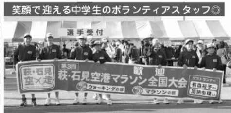
笑顔で迎える中学生のボランティアスタッフ◎