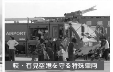
萩・石見空港を守る特殊車両