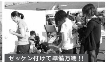
セッケン付けて準備万端!!