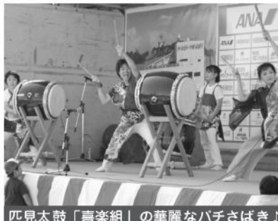
匹見太鼓「喜楽組」の華麗なハチさばき