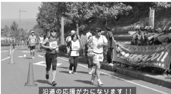
沿道の応援が力になります!!