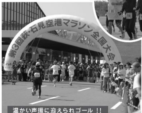
温かい声援に迎えられゴール！！