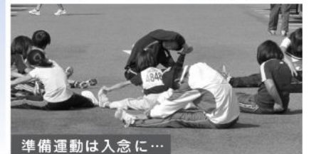
準備運動は入念に…