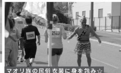
マオリ族の民俗衣装に身を包み☆