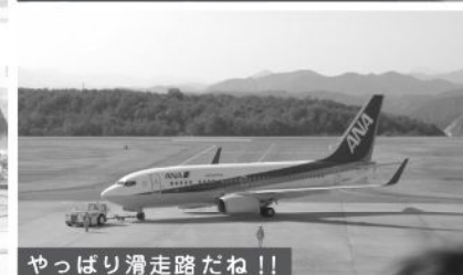
やっぱり滑走路だね！！