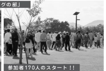
参加者170人のスタート!!