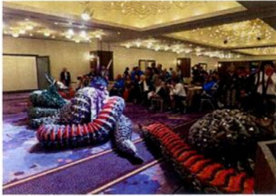
第33回総会・懇親会

年一回の総会・懇親会、毎月の「益田会だより」と市の広報配布、部会として毎月のハイキング、春秋のゴルフコンペが主な活動で、その他に地元と連携して、六月のメロン、十月の西条柿などのふるさとの