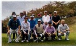
今秋で35回目となる ゴルフコンペ