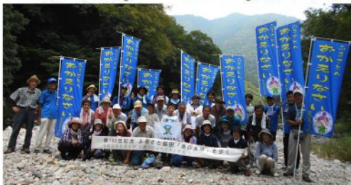
第190回ハイキング (令和元年8月14日)

農産品の斡旋販売等々が主なものです。これらの活動の記録や写真・動画等は会のホームページに詳しく収容いたしております。活性化への取り組みとして、「市長との意見交換会」、「美味しいものを食べる会」等を一度は実施できましたが、これもコロナに大きく影響を受けてしまい、定着するにはまだまだこれからです。過去の活動を振り返りますと、石見空港（現萩・石見空港）の開港した平成五年七月二日に石見の開港一番機で会員五四名が益田に飛び、地元で総会を開催いたしました。平成一四年からハイキング部会が、平成一七年からはゴルフ部会も活動を開始しました。ハイキング部は今年七月で二二一回目を重ね、節目の回では一泊二日の企画をするなどしております。また、一九〇回目「ふるさと益田を歩く」特別企画で、季節便の空港利用者も含め二四人が参加しました。地元からもコラボ参加者があり、初日に表見映を二日目はみと自然の森をハイキング