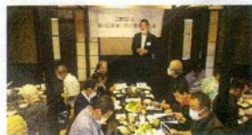
美味しいものを食べる会