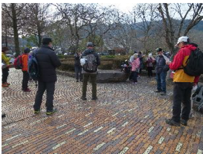
益田市歌など歌う