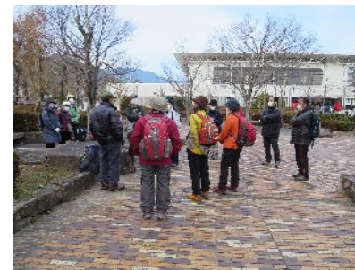
今後のハイキング打ち合わせ