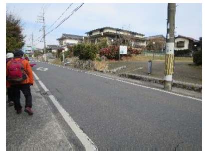
近江大津宮錦織遺跡前