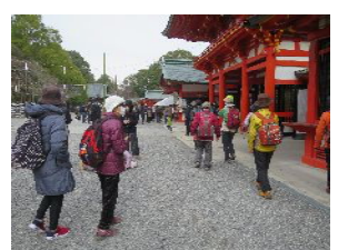
近江神宮に於いて