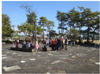
皇子山総合運動公園