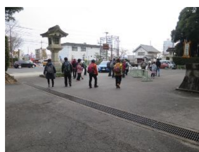
近江神宮 第一鳥居前