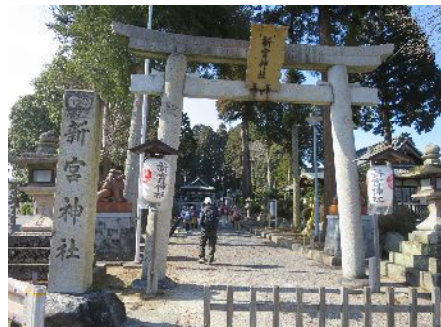
紫香楽一乃宮新宮神社