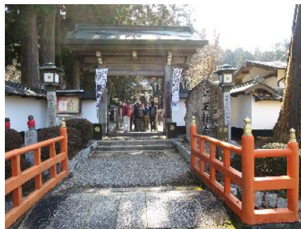
玉桂寺(ぎょっけいじ)