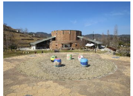
陶芸の森 信楽産業展示館