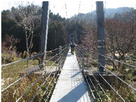
玉桂寺前駅 保良の宮橋

信楽の里は、険峻な峡谷を縫って流れる大戸川を起点とした標高300mの緑豊かな内陸盆地です。陶芸の森は、芸術の発信地として陶芸家の作品をいたるところに屋外展示しています。星の広場、太陽の広場、泉の広場など自然豊かな公園と屋外展示作品が楽しめます。