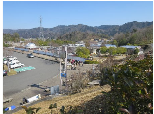
滋賀県立「陶芸の森」