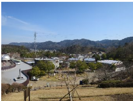
滋賀県立「陶芸の森」