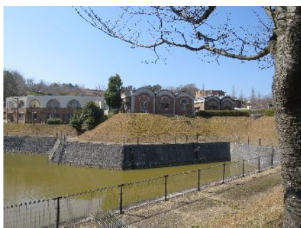
陶芸の森 創作研修館