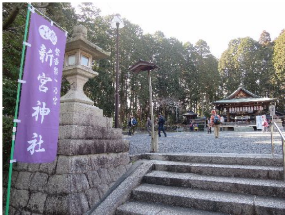
紫香楽一乃宮新宮神社