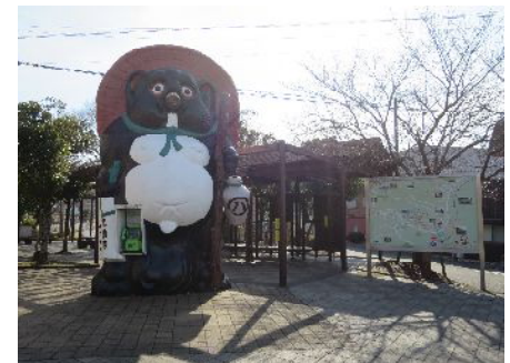
信楽駅たぬきでんわ