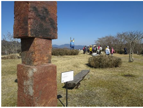
陶芸の森 星の広場