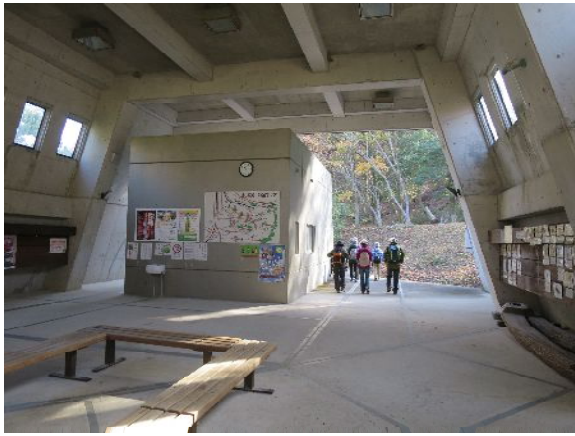
近つ飛鳥風土記の丘 休憩所