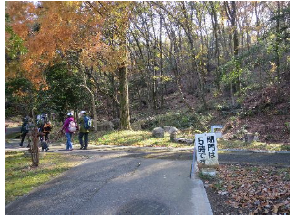
近つ飛鳥風土記の丘