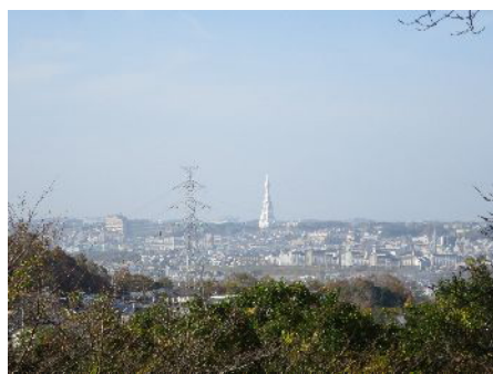
風土記の丘展望台