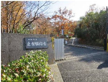
近つ飛鳥風土記の丘

近つ飛鳥とは奈良の飛鳥(遠つ飛鳥)に対してつけられた古称です。風土記の丘は、古墳群の一面を大阪府が整備したもので、20万平方メートルの園内に102基の古墳があります。持尾城は、南北朝時代楠木正行の挙兵に応じた平岩氏が平石城とともに築いた山城で、展望台からは淡路、六甲まで一望できます。また弘川寺は、役の行者の開基によるもので西行法師終焉の地として知られています。