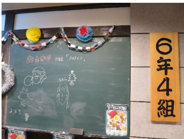
阿倍野・天王寺駅前分校の6年4組で忘年会