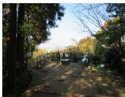
風土記の丘展望台