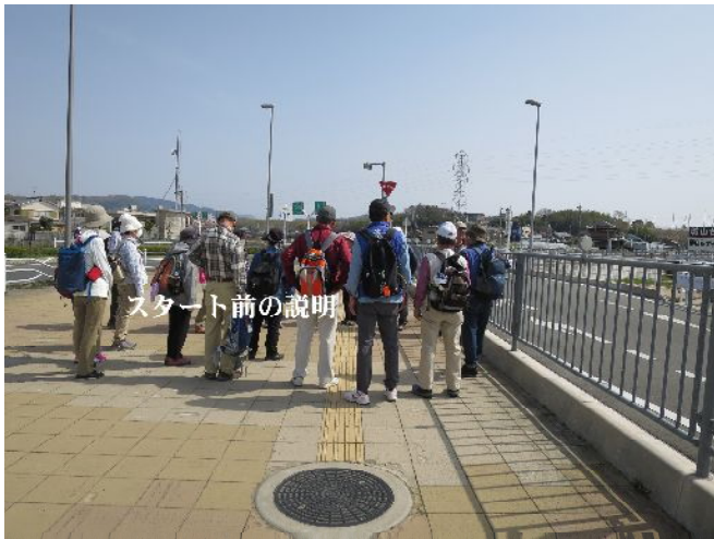
スタート前の説明