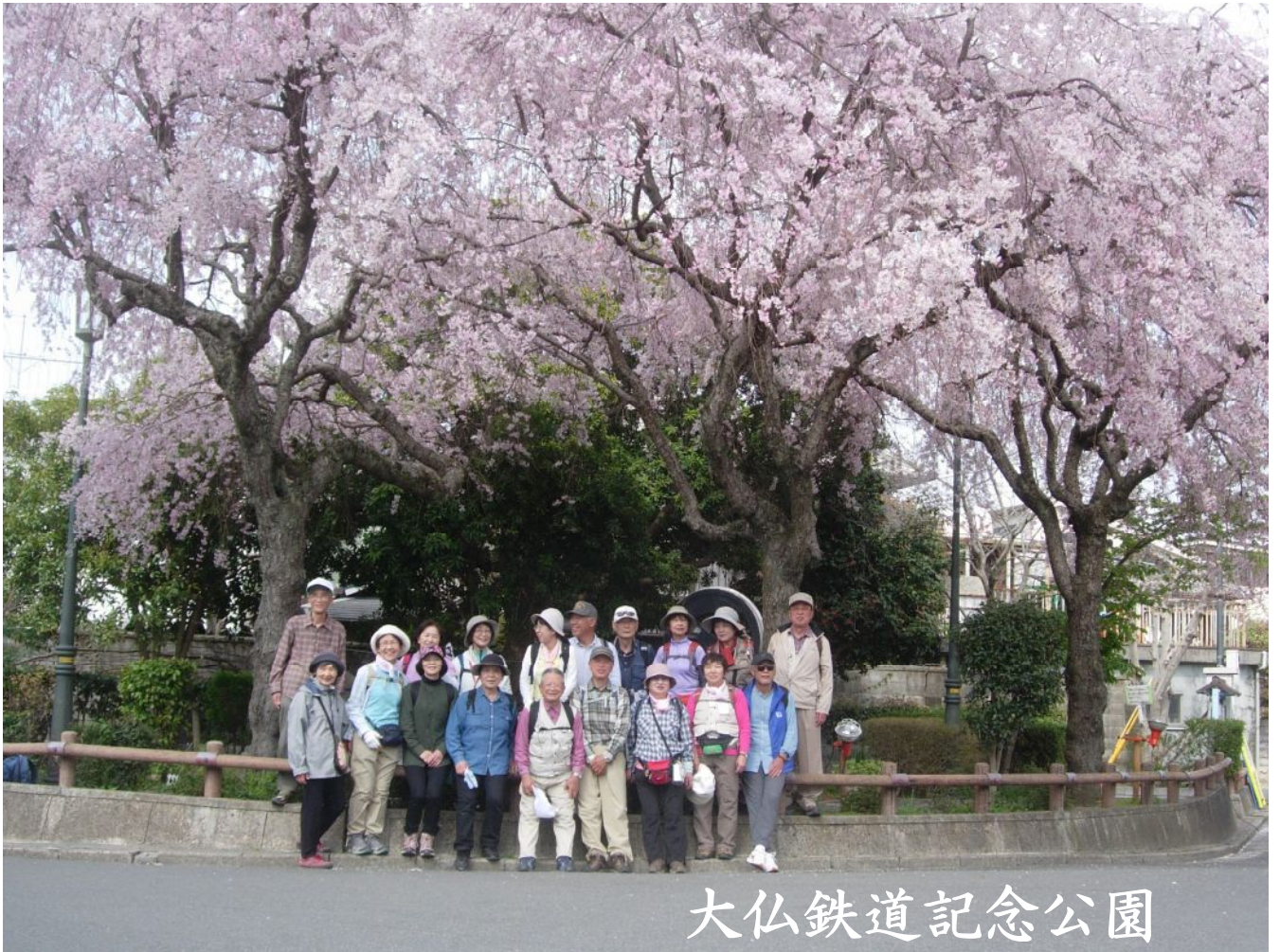
大仏鉄道記念公園