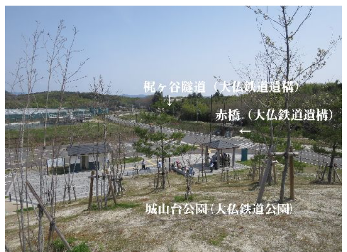
梶ヶ谷隧道 (大仏鉄道遺構)