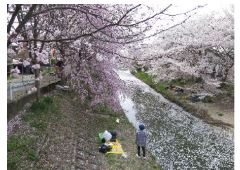
佐保川沿いの桜並木