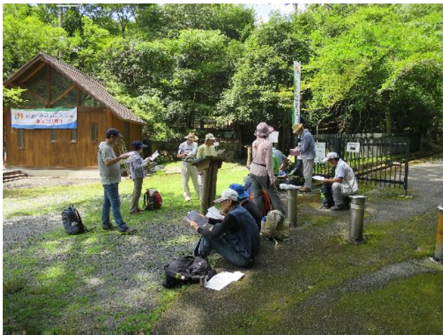
箕面ビジターセンターにて益田市歌を