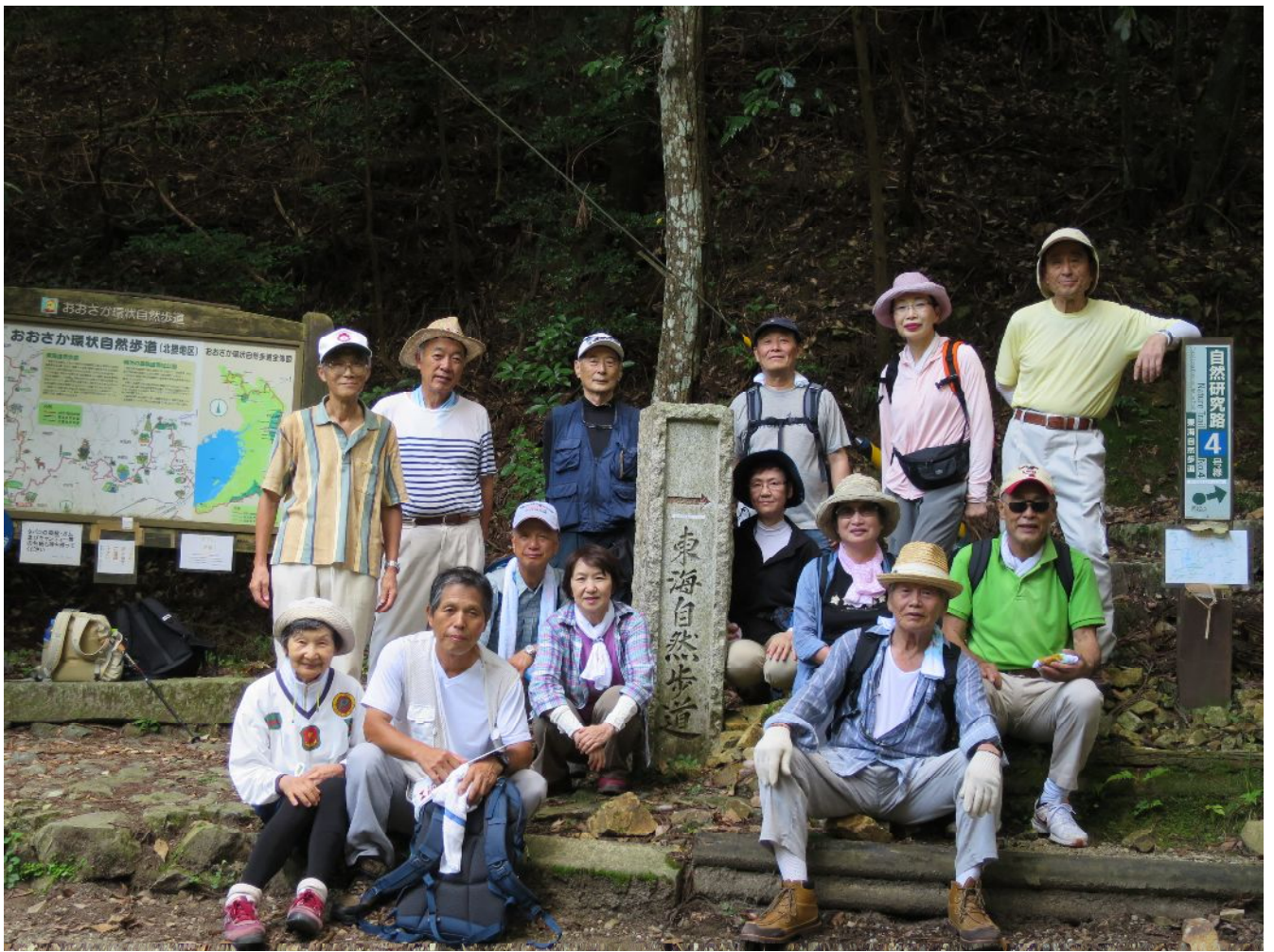
箕面ビジターセンター近くにて