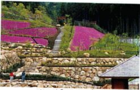
お里・沢中が ざめた参道 上子島沢砂防公園