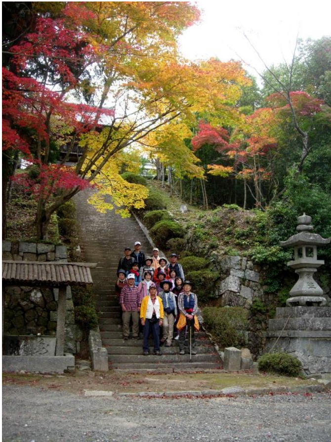
独鈷抛(とこなげ)山・千手寺

今回は、京都・亀岡市北部にある行者山(431m)に登ります。 山頂付近は巨岩が多く、少し険しい登りもありますが、久しぶりに登山気分を味わいましょう。弘法大師ゆかりの千手寺のカエデ、イチョウの紅葉は見ごたえがあり、ここからの眺望も楽しめます。