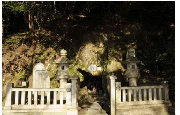
法垂の窟 (ほうたるのいわや)