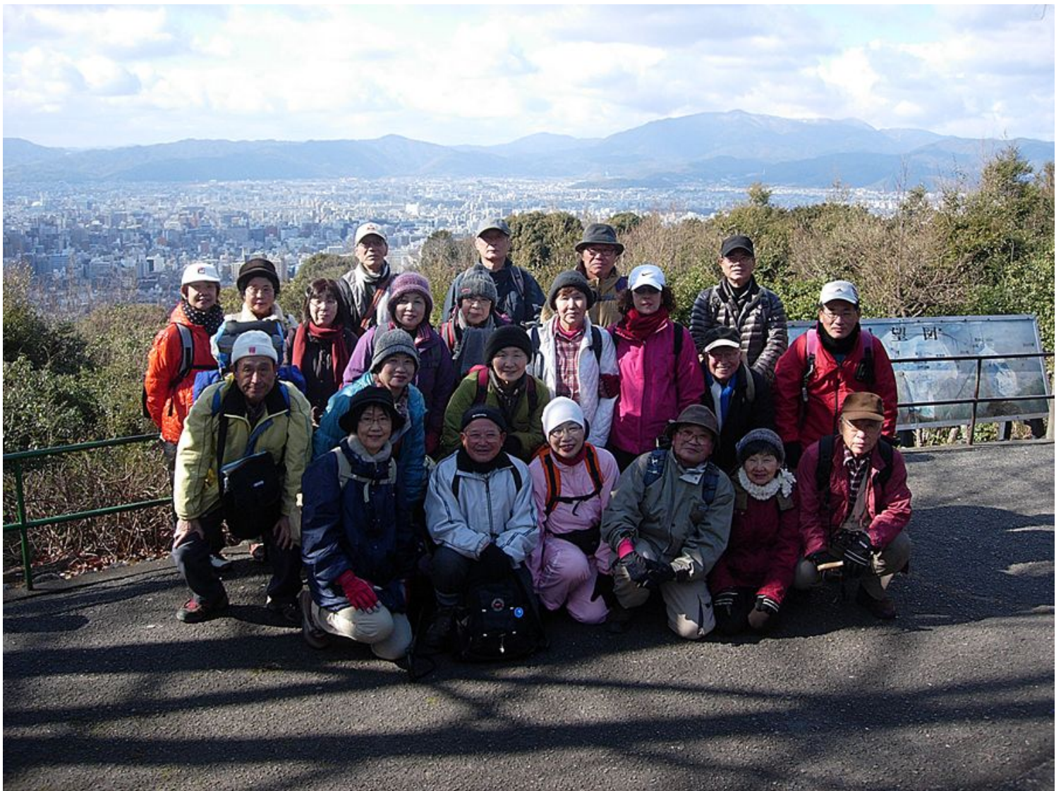
將軍塚の展望台にて

今年最初のハイキングは風もなく良い天気にも恵まれました。八坂神社、除夜の鐘で知られる知恩院の鐘楼と進み將軍塚に到着、展望台から京都の中心部が一望できました。昼食は餅の入った豚汁、薄日もさして話が弾みました。清水寺の音羽の滝、清水の舞台を見て、三年坂、二年坂、石塀小路を通り、スタート地点の八坂神社へ帰ってきました。