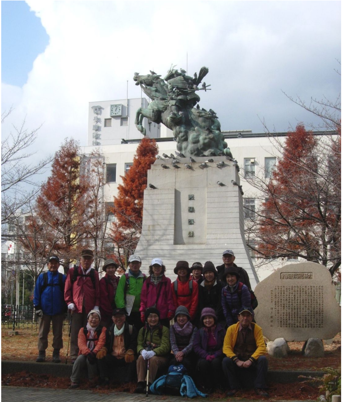
湊川公園の楠木正成の像の前