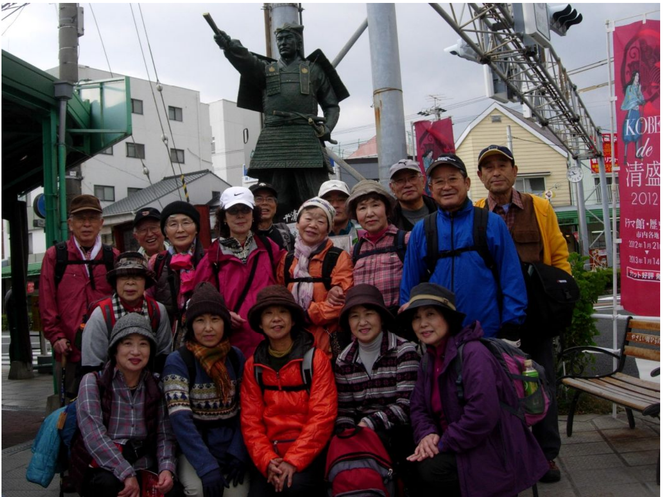
平野商店街の清盛像の前