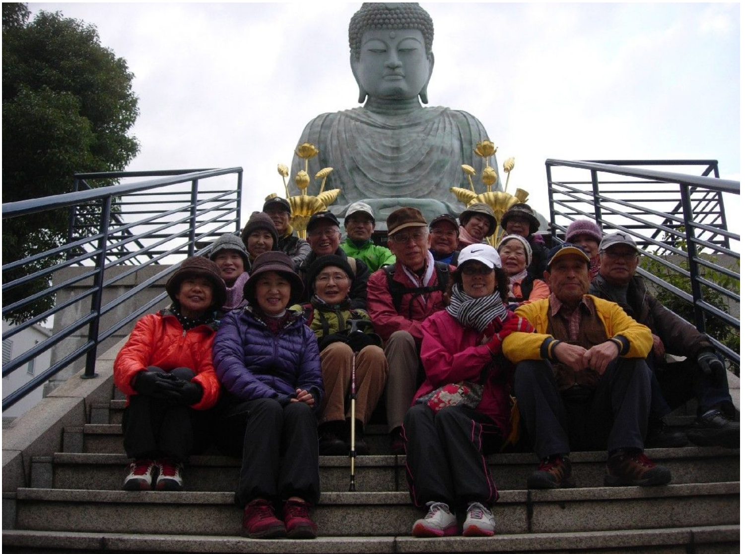
能福寺の兵庫大仏の前

昼食は湊川公園、将棋を楽しんでいた常連も席を譲ってくれ、暖かい味噌汁 をいただきました。