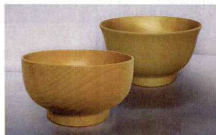
工芸品 [森の器、雪舟焼]