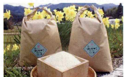
米[こしひかり、きぬむすめ、つや姫等]