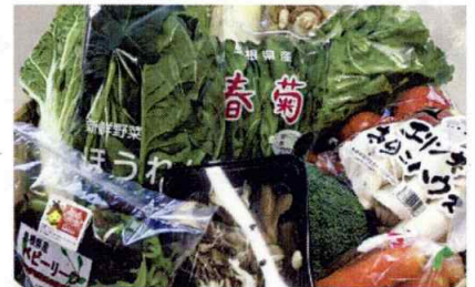
益田の野菜詰め合わせ