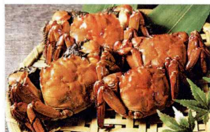
清流高津川産品[天然鮎、もみじガニ等]