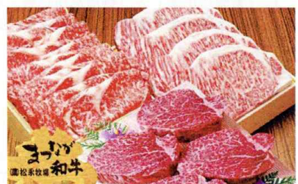
肉類[牛肉（松永和牛等）、しし肉等]

【お問合せ先】 〒698-0024 島根県益田市駅前町17番1号 益田駅前ビルEAGA内 益田市産業経済部 産業支援センター ふるさと納税担当 電話番号：0856-31-0332 / FAX番号：0856-22-0437 E-mail：furusatokifu@city.masuda.lg.jp