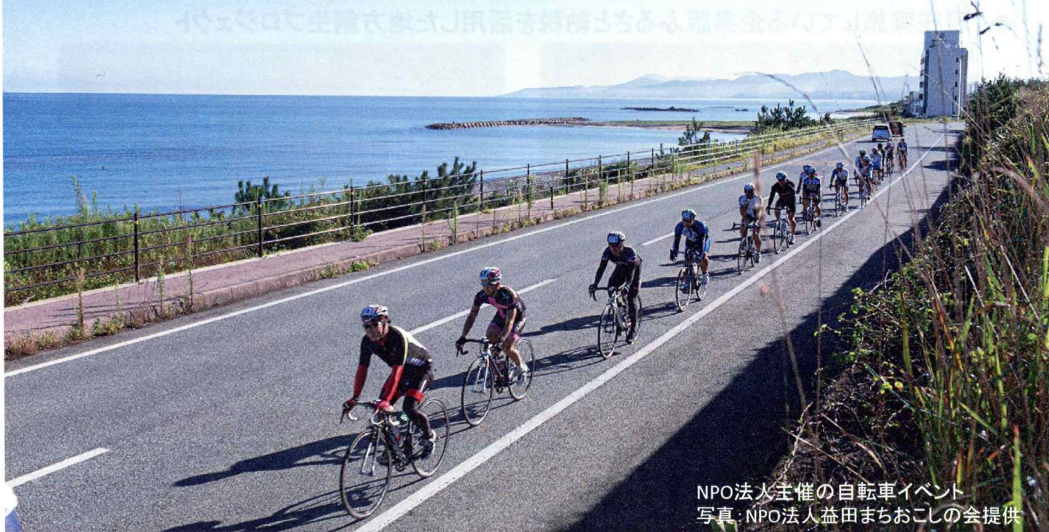
NPO法人主催の自転車イベント