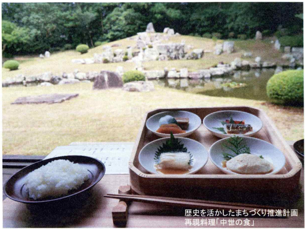
歴史を活かしたまちづくり推進計画 再現料理「中世の食」