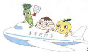
ますだ暮らしキャラクター (わさまる、ぐりお、ゆずりん)

益田市役所 政策企画課 〒698-8650 島根県益田市常盤町1番1号 tel.0856-31-0121 fax.0856-23-7708 Mail: seisaku@city.masuda.lg.jp URL: http://www.city.masuda.lg.jp/