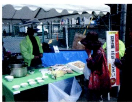
【益田鍋振る舞い】 11時～