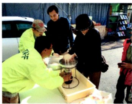
【お米のすくいどり】 ①10時～②12時～