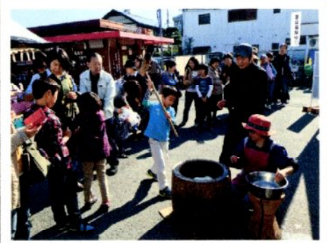
【餅つき振る舞い】 ①11時～②13時～