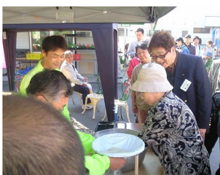
【お米のすくいどり】 ①10時～②12時～