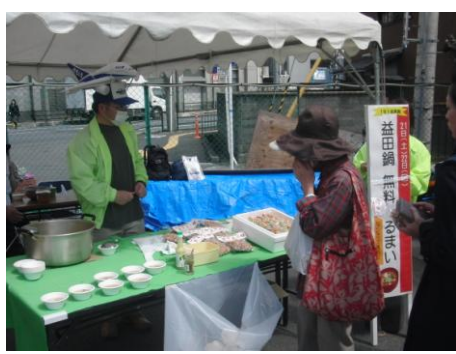
【益田鍋振る舞い】 11時～