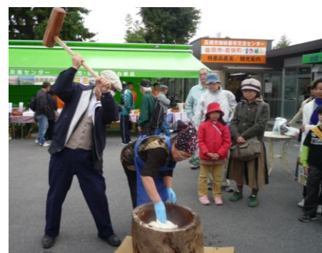
【餅つき振る舞い】 ①11時～②13時～