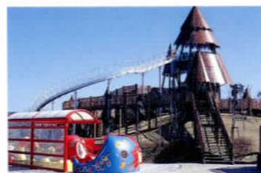
アクアスランド(伏型すべり台付のフィールドアスレチック)