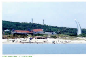
波子海水浴場 アクアスから徒歩約5分