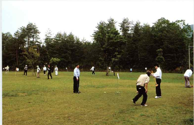
グラウンドゴルフ場コース(2コース)は 日本グラウンド・ゴルフ協会認定コース