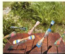
スーパー竹とんぼ教室