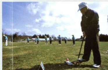
風の原コース (1コース)