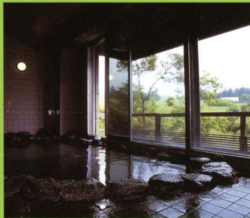
風の国温泉【大浴場】

窓の向こうに広がる「風の池」を眺めながら、ゆったりおくつろぎいただける「大浴場」。バラエティに富んだ浴場設備が充実しています。（泡湯・マッサージ湯・寝湯・サウナ）