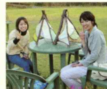
ランプシェード作り