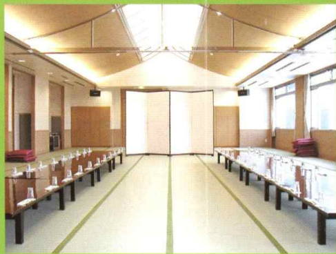
コンベンションホール