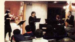
《雪舟句遊イベントⅪ》

共催: 益田観光ガイド友の会 八景園・雪舟小径ライトアップ / お茶・ぜんざい提供など