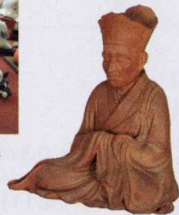
高村光雲《雪舟禪師像》(市指定)