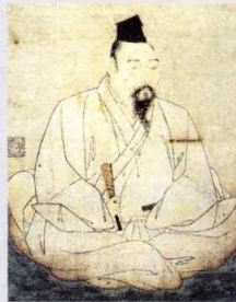
雪舟《益田兼堯像》(部分・重文) 展示期間 ① 4/26④→5/6④ ② 11/1④→11/30④