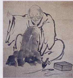
雲谷等《把針之図》(部分)