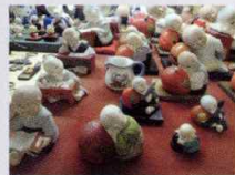
沢山の雪舟小僧さん人形がお待ちしています。