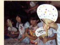
《第1回MYうちわを作ろう》